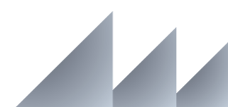
ГРАФИК ВЫХОДА ЖУРНАЛА «ВЕКО-ПРАЙС» НА 2020 ГОД