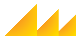
ГРАФИК ВЫХОДА ЖУРНАЛА «ВЕКО» НА 2020 ГОД